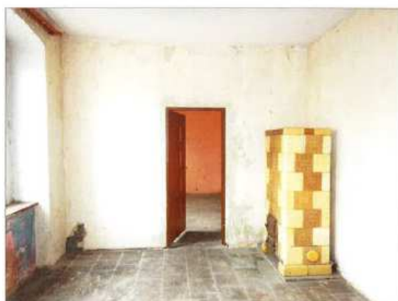
Widok fragmentu pokoju.