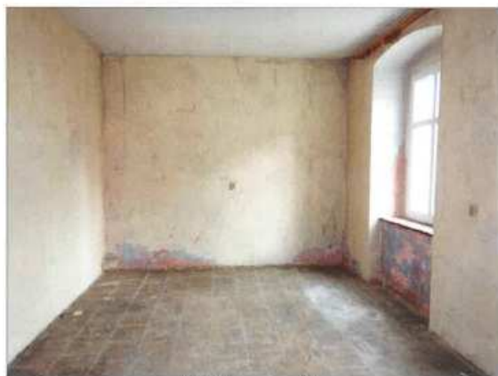
Widok fragmentu pokoju.