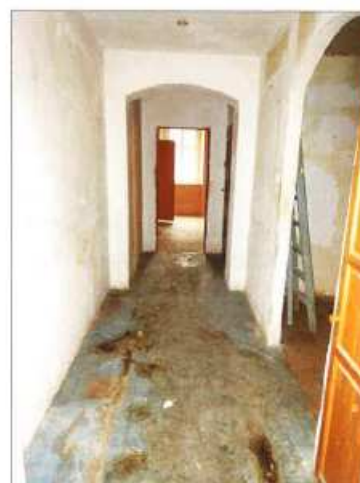
Widok fragmentu przedpokoju.