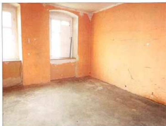
Widok fragmentu pokoju.