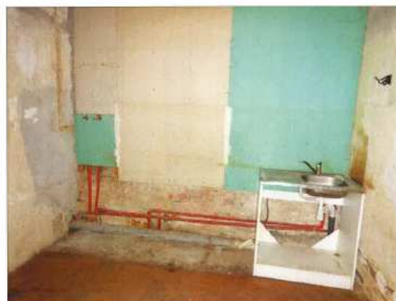
Widok fragmentu kuchni.