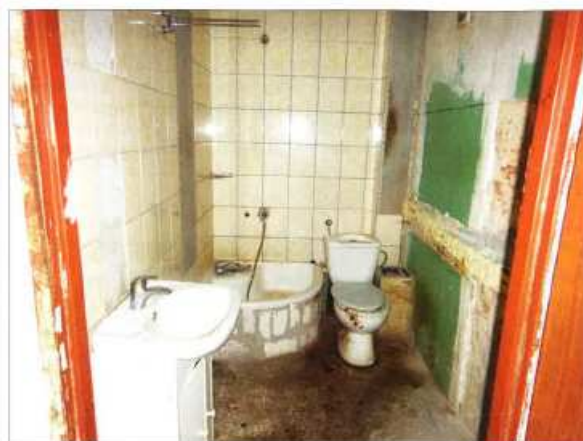
Widok fragmentu łazienki z wc.