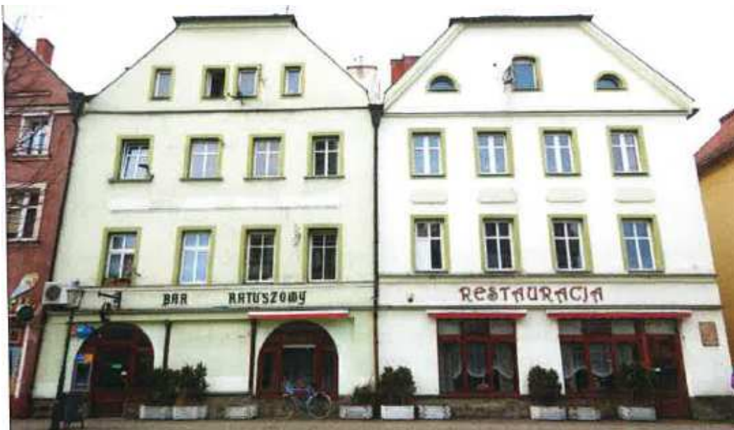
Widok elewacji frontowej – Rynek nr 13

na sprzedaż lokalu mieszkalnego Nr 1 znajdującego się w budynku położonym w Lubaniu przy ul. Rynek 13 wraz z udziałem we współwłasności nieruchomości gruntowej (działka nr 15, AM 3, Obręb III o powierzchni 505 m 2 , JG1L/00016287/0)